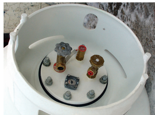
Maxiflasken har tilkoblinger for både gass- og væskeuttak.