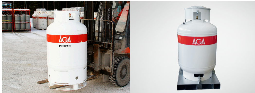
Maxiflasken kan enkelt løftes med truck.